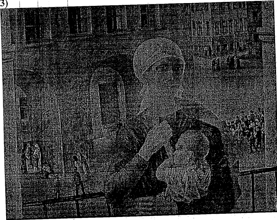
«1918 год в Петрограде»