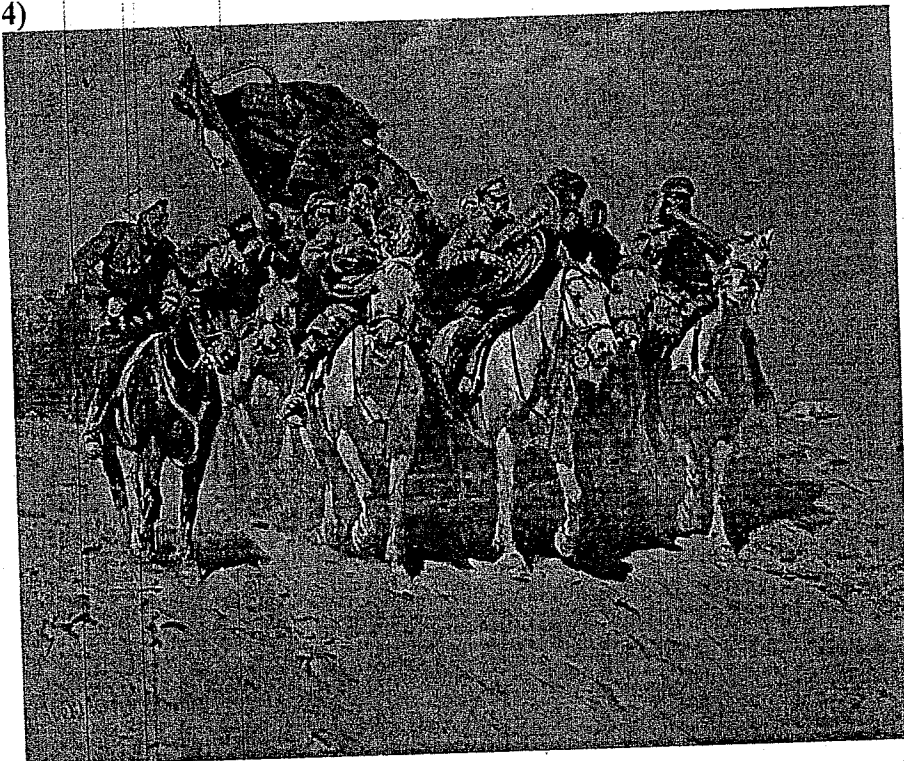
«Трубачи Первой конной»